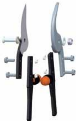
P160: NŮŽKOVÁ STŘÍHACÍ HLAVA