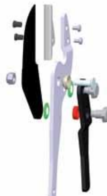
P172: STŘÍHACÍ HLAVA S KOVADLINKOU